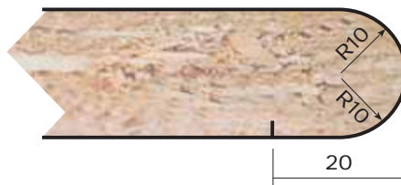
UR10 Espesores: 19 y 22 mm. Thicknesses: 19 and 22 mm.