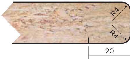
UR4 Espesores: 25 a 30 mm. Thicknesses: 25 to 30 mm.