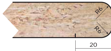
UR6 Espesores: 19 a 30 mm. Thicknesses: 19 to 30 mm.