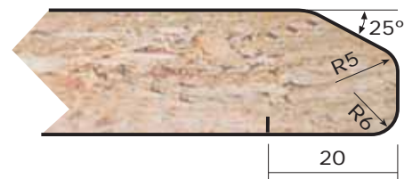
BU Espesores: 19 a 30 mm. Thicknesses: 19 to 30 mm.