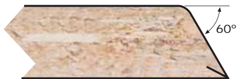
PI60° Espesor: 16 mm. Thickness: 16 mm.