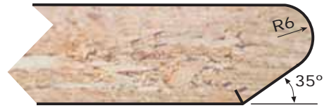
PF Espesores: 16 a 30 mm. Thicknesses: 16 to 30 mm.