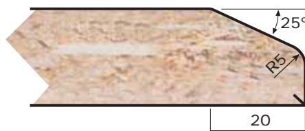
Bisel Espesores: 16 a 30 mm. Thicknesses: 16 to 30 mm.