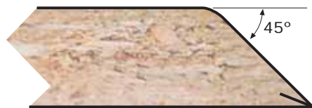
PI45° Espesor: 16 mm. Thickness: 16 mm.