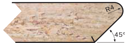
PFM Espesores: 16 y 19 mm. Thicknesses: 16 and 19 mm.