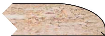
OV Espesores: 16 a 30 mm. Thicknesses: 16 to 30 mm.